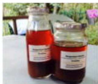
100% Natural mangostin enzyme (Juice) (residue for cleaning)