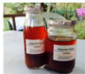
100%ナチュラル マンゴスチン エンザイム (ジュースとして)(クリーナーとして)