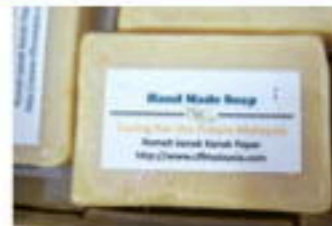
無添加有機石鹼 (レモンガラス、モリンガ等の成分入り)