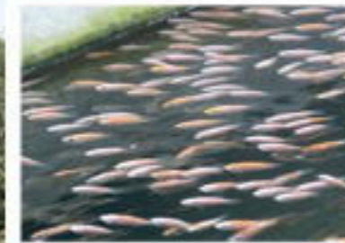
テラピア ナマズを養殖中