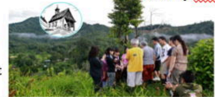
Wishing a chapel build on the hill with thanks for the completion and pray for peace and future of children