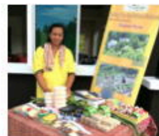
Sell at ① CFFM site at ② local site