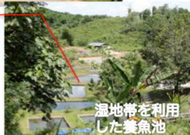
湿地帯を利用した養魚池