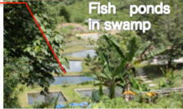
Fish ponds in swamp